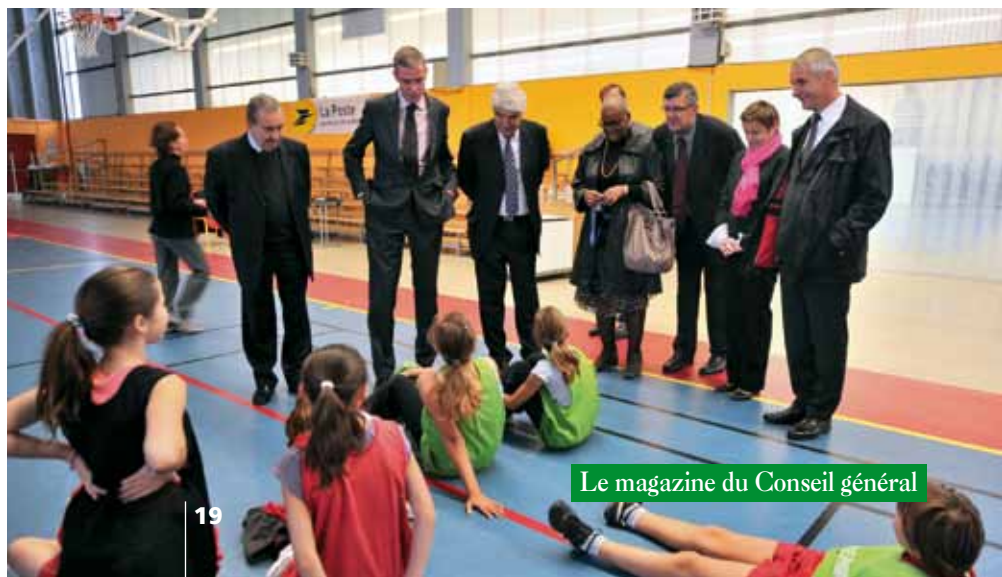
Le magazine du Conseil général